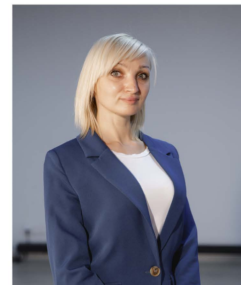
ТЕРЕШКОВА Наталья Юрьевна